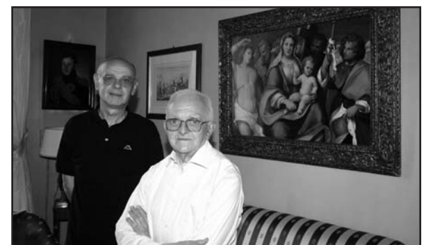
Visita al palazzo-museo di Corso Magenta.

A Montichiari c'è chi ha tentato storielle puerili, come già in altre occasioni, per attribuirsi meriti personali dalla donazione del notaio Lechi. Favole! che nel far torto alla verità suonano grave offesa e mancanza di rispetto verso il donatore, stravolgendo la chiara finalità democratica di fare oggetto del suo lascito l'intera popolazione di Montichiari.