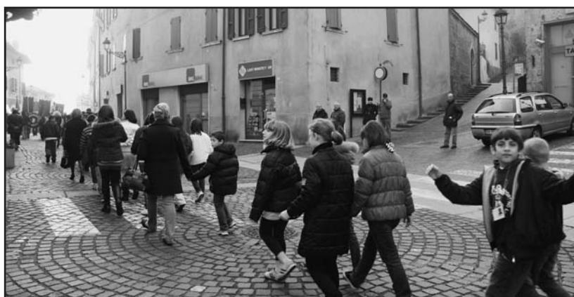
Numerosa la partecipazione delle scolaresche.