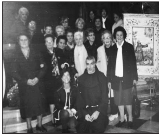
La foto ricordo delle Francescane dopo la Santa messa in Duomo.

Numerosi i giovani attori che animano la storia e la scena, con presenze significative quali Pietro Bernardone padre di Francesco, che incarna in modo estremamente attuale il conflitto tra padre e figli, tra