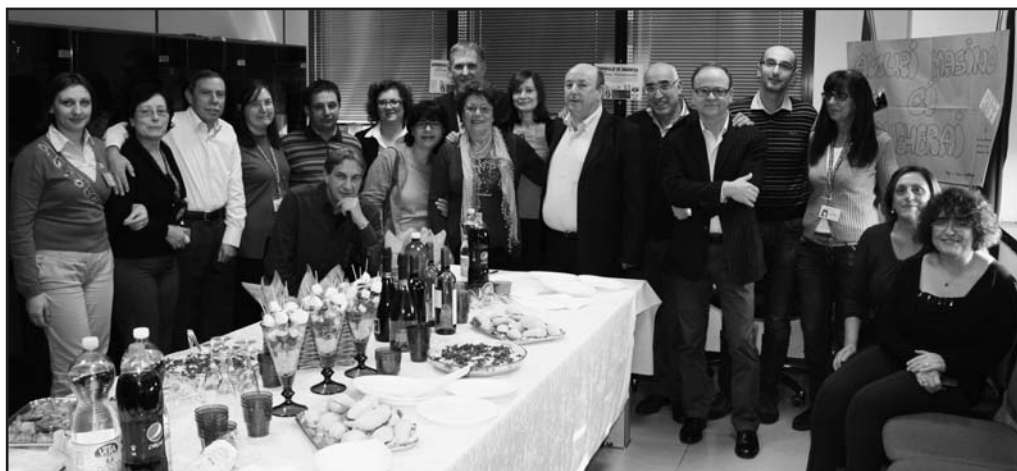
Danzì al centro con i colleghi di lavoro.