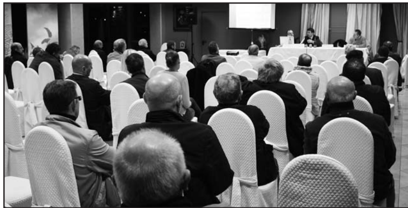
Il convegno svoltosi nella capiente sala del Daps Casa Nicoli.

Si è parlato dei tempi tecnici di approvazione che potrebbero